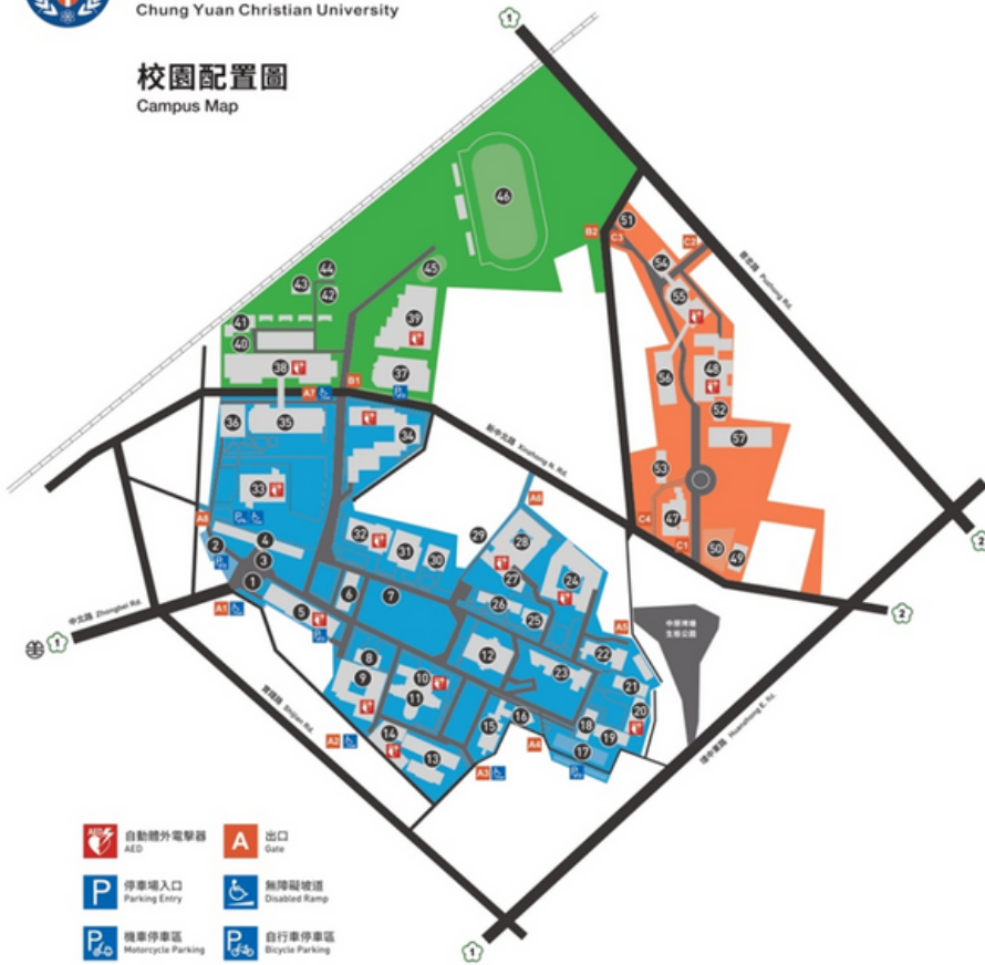
校園配置圖 Campus Map